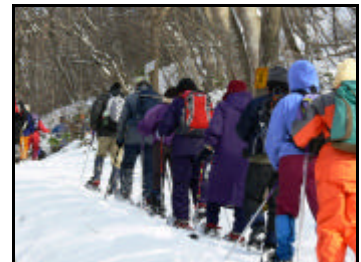
「スノートレッキング」