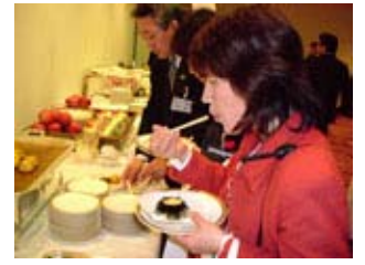
第1部の意見交換会、第2部では青森の食を紹介しました