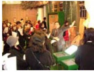
北洋硝子と森林博物館での様子