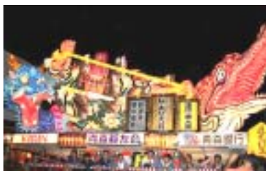
ねぶた大賞：青森菱友会