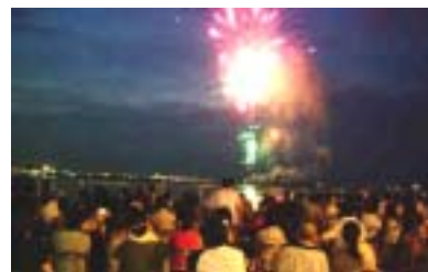
フィナーレを飾る花火大会