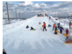
大型すべり台を楽しむ子供たち