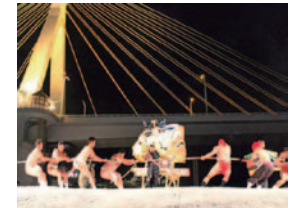
「もつけ」による雪上の綱引