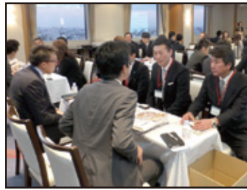
昨年の東京開催の様子

2016年3月26日(土)の北海道新幹線開業に向け、青森・弘前・八戸・函館の観光コンベンション協会合同による観光プロモーションを11月24日(火)に札幌市で実施いたします。北海道新幹線開業や青函全体、各市の観光プレゼンテーションなどを行い、青森県・函館広域観光の魅力をPRしてまいります。