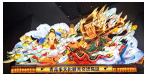
「琉球開闢神話」制作:北村麻子氏

日時:12月18日(日) / 13:45~14:45 (受付13:15~) 場所:ねぶたの家ワ・ラッセ 1F 交流学習室1 定員:60名(当日受付の先着順) 講師:北村麻子氏 ※ねぶたミュージアム入場料を頂戴いたします。