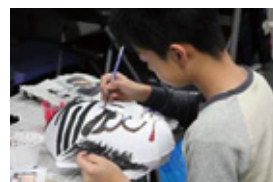
過去の面づくり教室の様子

申込方法:お電話にて(☎017-752-1311)、12月1日(木)9:00~受付開始 開催日時:1月7日(土)~8日(日) / 9:30~15:30 開催場所:ねぶたの家ワ・ラッセ 1F 交流学習室1 定員:20名(定員になり次第募集終了) 参加費用:1,500円(当日支払い) ※ご参加された方はワ・ラッセ駐車料金が無料 参加条件:2日間とも参加できる方、小学5年生以上(小学生は保護者同伴)、昼食は各自用意 注意事項:1人1個の制作、不参加を理由に教材の持ち帰りは不可