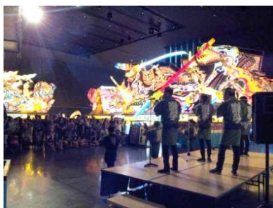
ハネト体験ショー