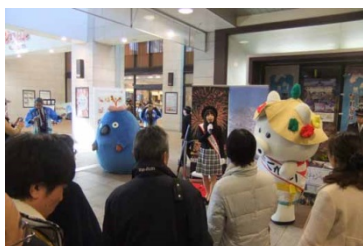
観光キャンペーン