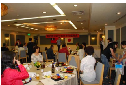
新竹縣政府青森ねぶた視察団歓迎会