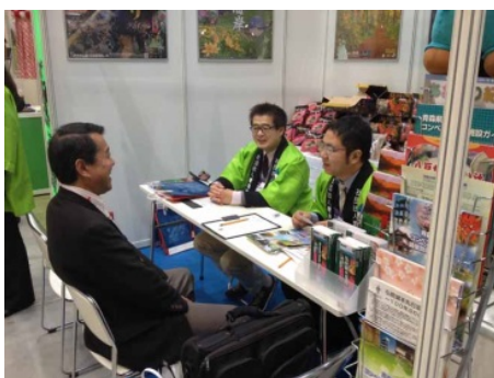
国際ミーティングエキスポ