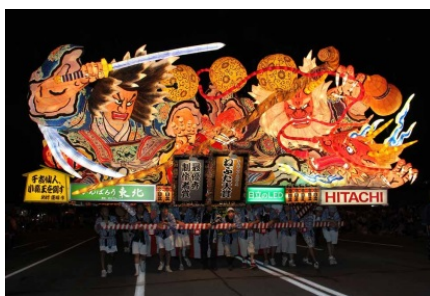
平成25年度ねぶた大賞